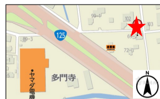
◎駐車場：有（5台） 北側空地に駐車可能です