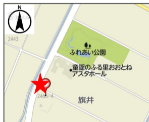
◎駐車場：無（近くに公共施設駐車場があります）

愛らしい花を房状にたくさんつけるポールズヒマラヤムスクが庭のシンボルローズに。また、鉢植えのバラは、花色や花期、風情に応じて移動し、好みの雰囲気をつくるのに役立っています。今年もうまく咲いてくれればと願っています。