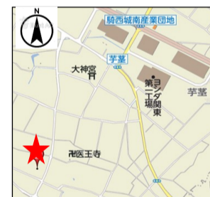
◎駐車場：有 （敷地内5台近隣5台程）

バラの季節にも参加できることになりました。皆さんがいらっしゃるのをお待ちしております。また今年もお会いしましょう！